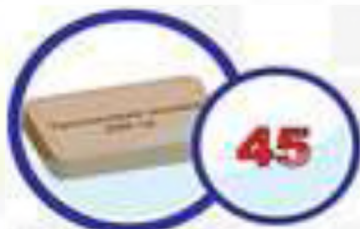
ШАШКА 200 Г