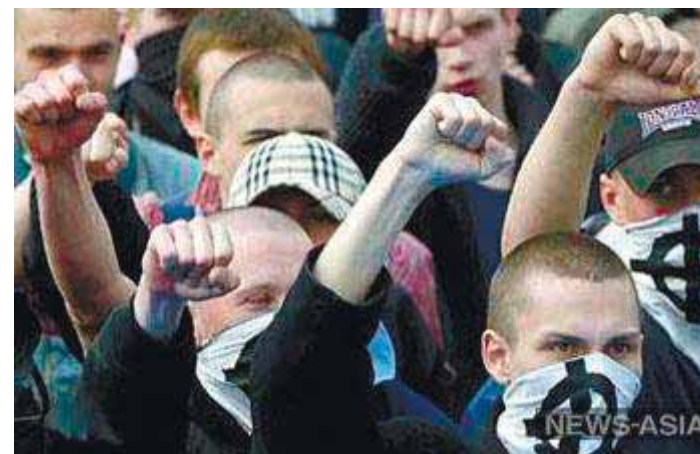
В Костроме скинхеды напали на неформалов